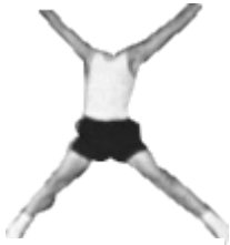
Ludvík XIV v úboru, bez dlaní, bez hlavy a s rozkročenýma nohama.

drahé generace po nás neděste se, brzy bude po nás