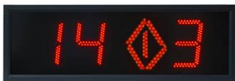
Hodiny s píčou.

Neboj se, chlapče, už tě dlouho ze spánku rušit nebudou. Kukačkové hodiny po babičce.