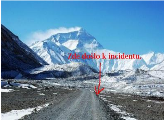
Zde nikdy nestál Ludvík XIV